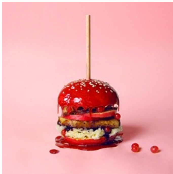
© Fat & Furious burger Burger d'Amour, 2013

Vernissage le 17 juillet de 18h30 à 21h LA GALERIE au rez-de-chaussée du magasin