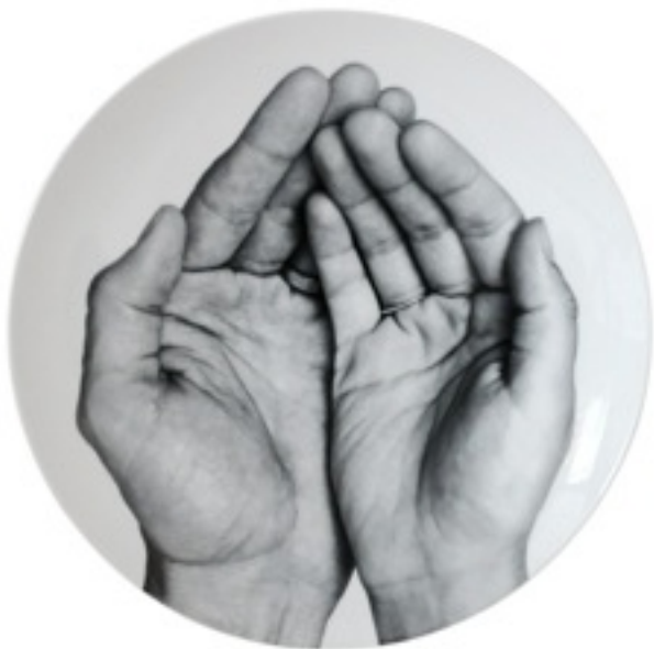
© Prune Nourry et Jr pour Bernardaud Je te mangerai dans la main

De plus, leur participation est sollicitée lors des expositions via des appels à projets. Ainsi pour « Miam ! », ils pourront envoyer des photos de "repas de famille" afin de créer un mur d'images chargées de souvenirs et d'émotions.